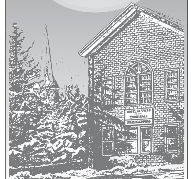
Illustration Jacques Lajeunesse

Encouragez nos entreprises locales ! Une bonne façon de garder la qualité de vie de notre beau village