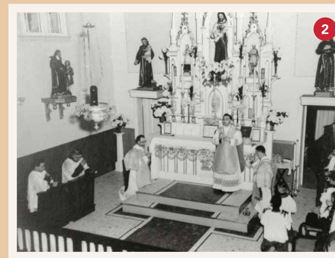
2 Intérieur de l'église Saint-François d'Assise avant le feu de 1971 The interior of Saint-François d'Assise church