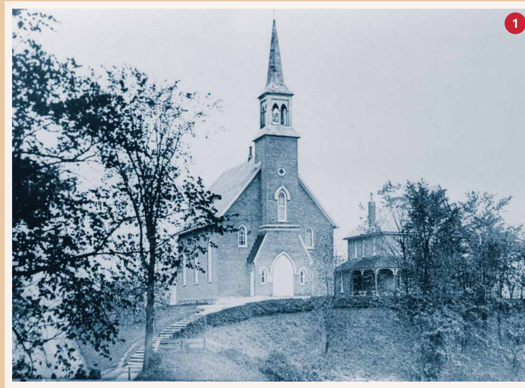
1 Église Saint-François d'Assise et presbytère, 1888 Saint-François d'Assise church and rectory